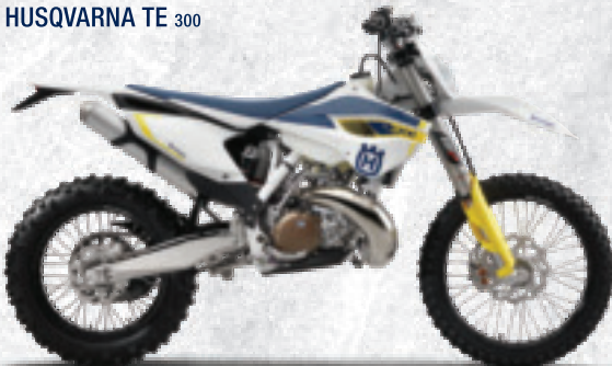
HUSQVARNA TE 300