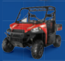
RANGER XP 900