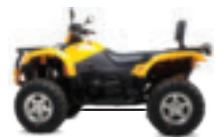
CF 500 A