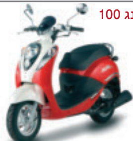
סאן יאנג 100 MIO