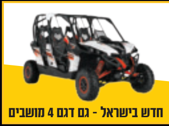
חדש בישראל - גם דגם 4 מושבים

כשטכנולוגיה, עוצמת ביצועים, איכות ונוחות נפגשים.