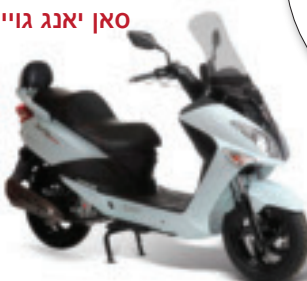
סאן יאנג גויריד 125