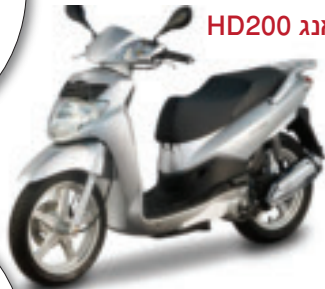
סאן יאנג HD200