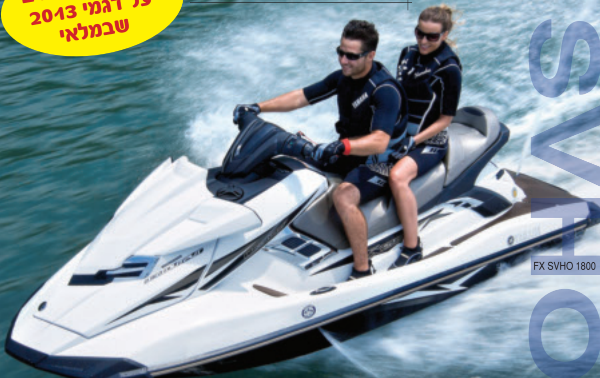
FX SVHO 1800