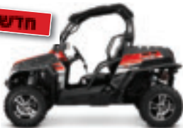
Z FORCE 800 EX