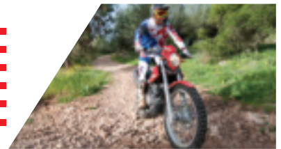
האופנוע ייססר עם כני גבוהה או נמוכה על פי העדפת הרוכח