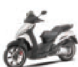
Geo300 / Geopolis125