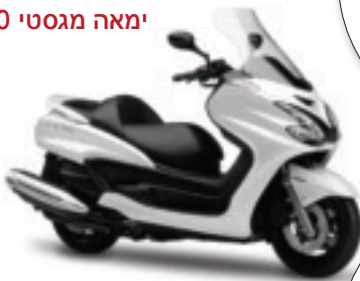
ימאה מגסטי 400