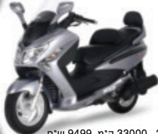
סאן יאנג גוי מקס 250